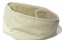
アイピロー ¥21,600(税込) W62cm×H10cm 82g