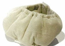
ヘッド&ネックウォーマー ¥24,000(税込) W60cm×H14cm 140g