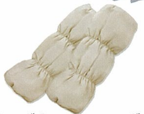
レッグウォーマーロング ¥70,000(税込) W42cm×H58cm 900g